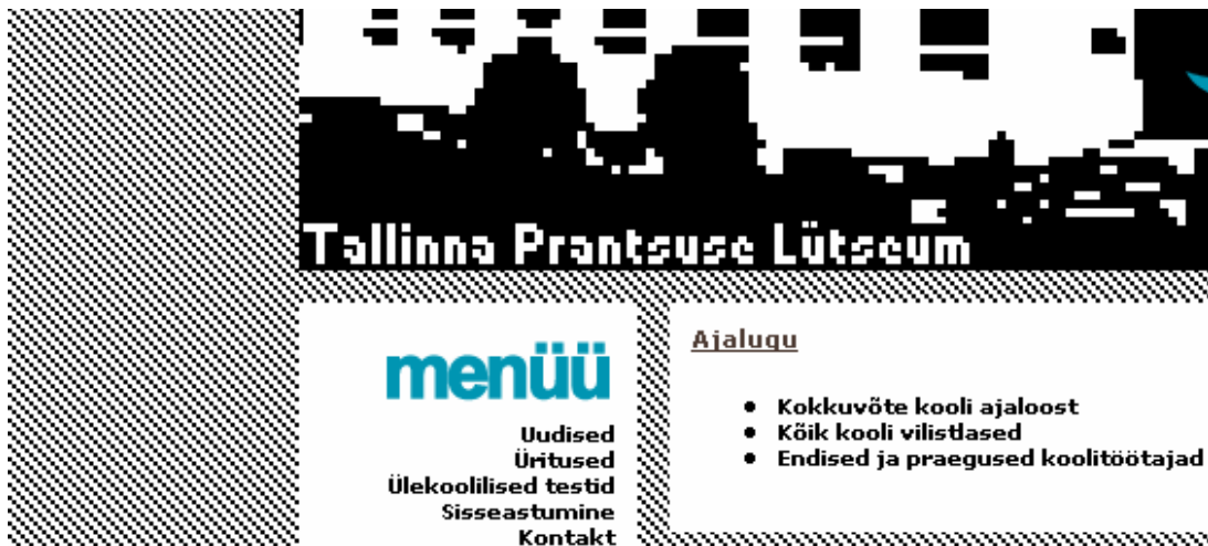
?????? 7. Web-???? ?????????????? ?????????????? ??????

? ??? ???? ???? ???? ???? ???? ???? ?????????? ?? ?. (???? 10,92 ?????). ?? ??? ? ???? ???? ???? ?????????????? ?????????? ??????. ?????????? ?????????????? ?????????? ?????????? ? ?????????? ???? ??????????, ?????? ?????????? ???? ?????. ?????-???? ?????? ?????? ?????? ? ?????? ?????? ?????????????? ?????? ?????????????? ?????????????? [?. ?????? 7].