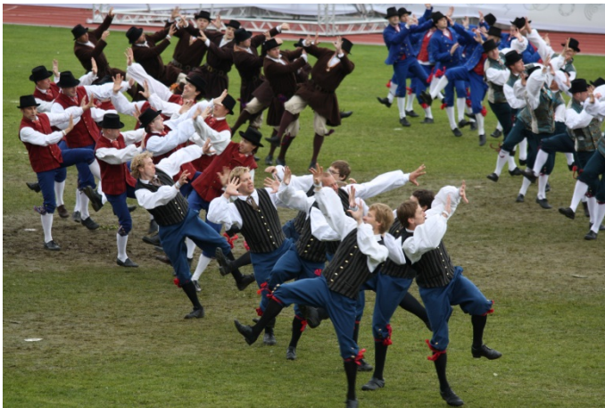
Fotomeenus 3 Meeste tants

Miks mehed? Miks tants? Traditsiooniliselt tantsisid Eesti mehed enamasti tüdrukute pilkamiseks ja nende tagasihoidlikkuse naeruvääristamiseks. Sageli tantsiti ka purjus peaga ja sellised tantsud sisaldavad tihti meestele endalegi teadmata elemente ürgsetest usulistest tantsudest. Mõnes Eesti paikkonnas on üldist tantsuvara kandnud poisid, kuna tüdrukutele on peetud tantsimist sobimatuks. Vanarahvas ütles, et kui meesterahvas hakkab tantsima, siis naisterahvas läheb nurka. MTP2 aga laseb meestel tantsida naiste ees – kõigi silme all!