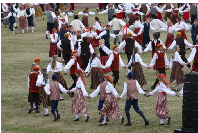
Fotomeenus 2 Tantsupeo kontserdil 2009

Viimane üldtantsupidu toimus 2.-4. juulil 2004. aastal. Enamik üldtantsupidudest on toimunud nõukogude võimu perioodil. Ideoloogiline surve oli tantsupidude puhul võrreldes laulupidudega oluliselt nõrgem. Esiteks polnud deklaratiivseid Leninit ja parteid ülistavaid tantse, mida saanuks kavasse suruda, teiseks olid korraldajad piisavalt nutikad. Kuna üldtantsupidu on terviklik lavastus ning staadioni väikese mahutavuse tõttu antakse publikule 3-5 etendust oli võimalik loobuda avakõnest. Kõne asendati selleks puhuks loodud luuletekstiga. Eredaimaks näiteks on Vladimir Beekmani tekst: “Eesti, mu südame kodu, visade isade maa. Teist nii armast ei ole ja iialgi olla ei saa.”. Kohustuslikus korras pidid kavas olema nn vennasrahvaste tantsud. Tantsiti läti, leedu, vene, valgevene, moldaavia, aga ka ungari, saksa jt rahvatantse, küll süitidena, küll eraldi. Nende esitamine oli pigem kasuks kui kahjuks.