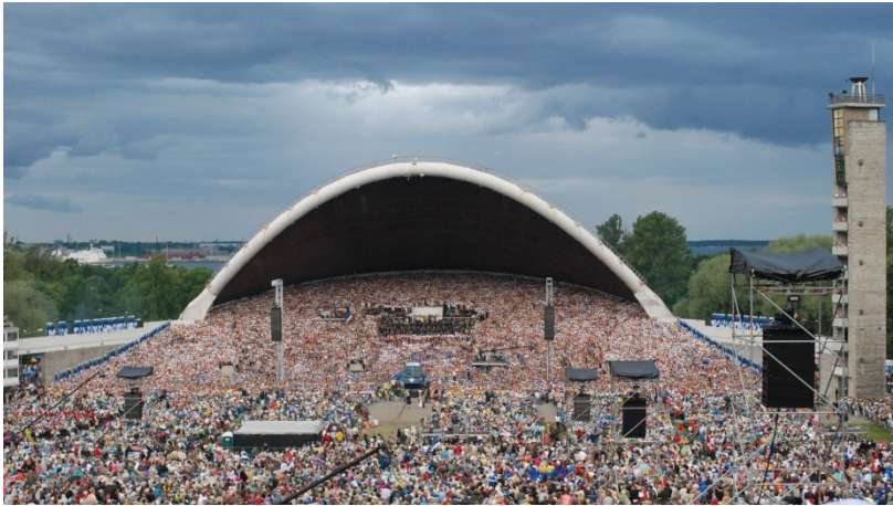
Fotomeenus 1 Laulupidu laulukaare all

ühendkoori lauljate arv 18 000-ni, kogu osavõtjate arv aga 25 -30 000ni. (Sihtasutus, Eesti Laulu- ja Tantsupeo)