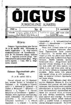
Joonis 2 Ajakirja õigus 1922 neljas number