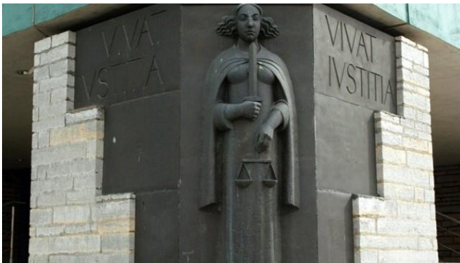
Joonis 1 Õigusjumalanna kuju Tallinna kohtuhoonel

Õigus on riigi kehtestatud või sanktsioneeritud üldkohustuslike käitumisreeglite kogum, mille järgimine tagatakse riiklike mõjutusvahenditega [Joonis 1]. See on sotsiaalne kord, mis reguleerib inimeste omavahelisi suhteid; ühe riigi sunninormide kogumik.