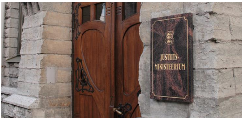
Joonis 5 Eesti Vabariigi Justiitsministeeriumi peauks

Ministeerium ei juhi haldusala asutusi mitte vahetult, vaid strateegiliselt: töötab välja nende arengusuunad, määrab eesmärgid ja analüüsib tulemusi, tagab eelarve, teeb järelevalvet jms.